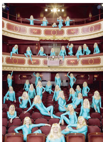
DamenLikörChor | Foto: Thomas Rausch